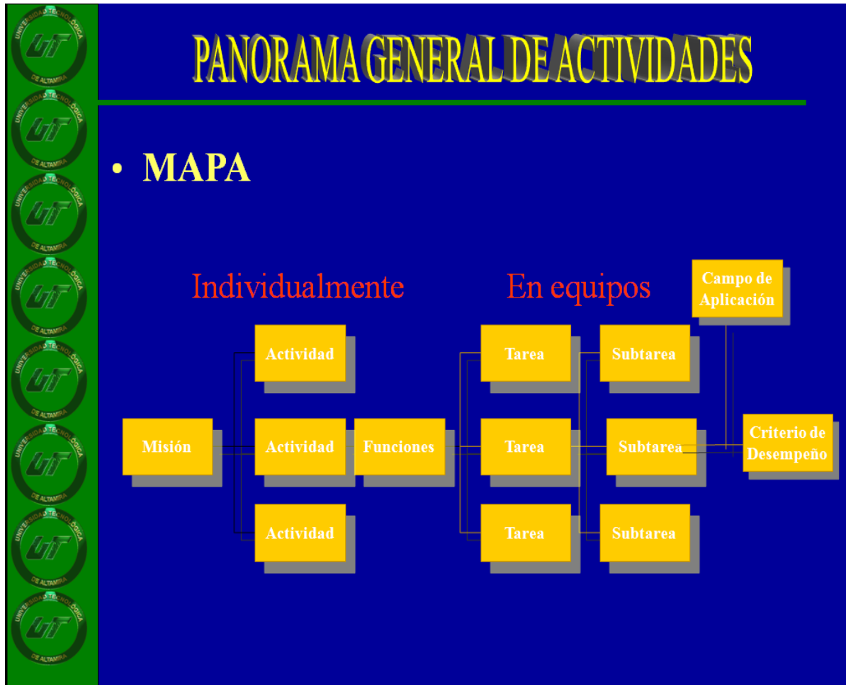
Figura 2. Dinámica del taller para el Análisis Situacional del Trabajo

a la derecha se indican las tareas, subtareas, criterios de desempeño y campo de aplicación que correspondieron al trabajo de equipo.