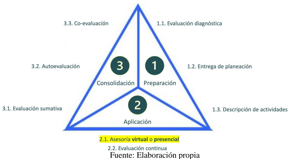
Figura 2. Variación del modelo original del AI

Tras el confinamiento, la opinión pública del profesorado expresaba que era imprescindible aplicar estrategias de nivelación de los conocimientos (Musaddiq, Stange, Bacher-Hicks y Goodman, 2022). Por eso había una sensación de urgencia por tener una fase presencial en el AI. Sin embargo, la preocupación sanitaria hizo que se valorara más la salud de la comunidad universitaria. En suma, se abrió la posibilidad de tener asesorías virtuales. Además, estudios previos en la facultad de esta universidad pública mexicana sugirieron que había un alto nivel de satisfacción entre el aprendiz respecto al uso de aplicaciones digitales sobre videoconferencias, gestión de información en la nube y uso de plataformas de gestión del conocimiento (Canchola, García y Chaparro, 2020).