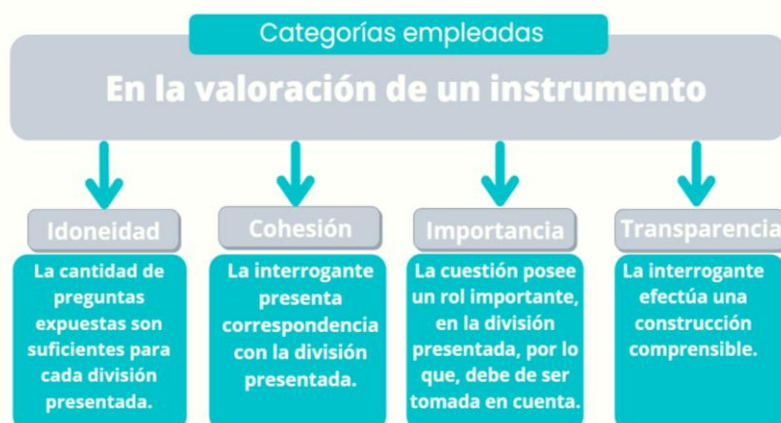
Figura 2. Factores empleados para valorar una herramienta.