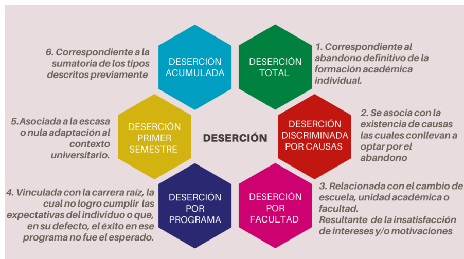
Figura 2. Categorías de deserción