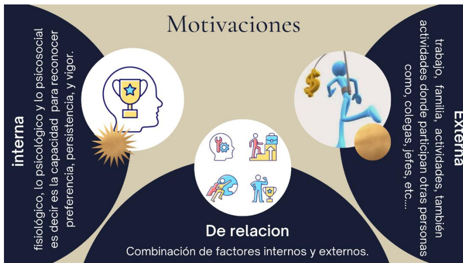
Figura 3. Tipos de motivaciones en los estudiantes