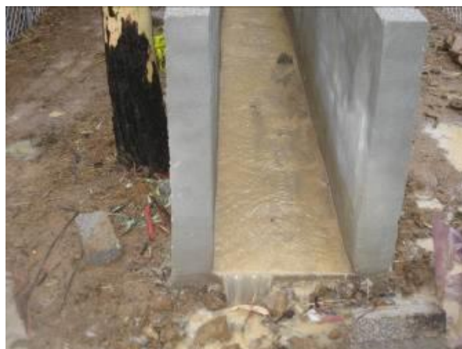
Figura 7. Gasto hidráulico registrado en el canal Parshall de la microcuenca 1, durante el evento de lluvia atípica de febrero de 2010.