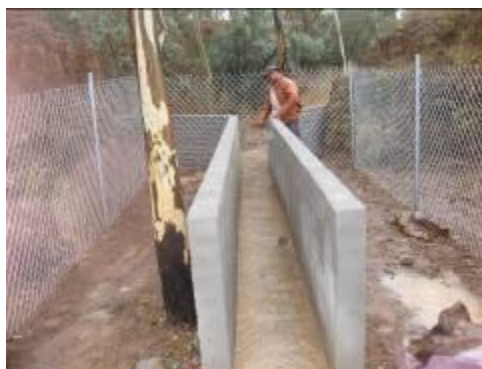
Figura 6. Funcionamiento hidráulico del canal Parshall modificado en la microcuenca I.