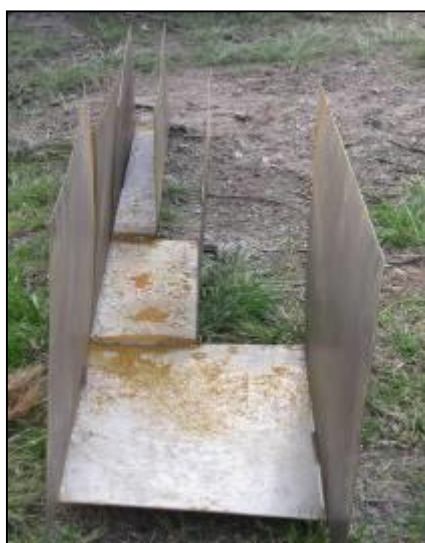
Figura 3. Canaleta dosificadora de agua y sedimentos vista en forma longitudinal por la boquilla de entrada.

Las microcuencas III y IV se instrumentaran solo con canaleta dosificadora y trampa cisterna. En estos casos la canaleta dosificadora se empotrará en la boquilla, sobre la cepa y conectando con la tabla y plástico aislador, de tal forma que el escurrimiento y sedimentos entren totalmente al conducto y sean canalizados y dosificados hacia la trampa cisterna.