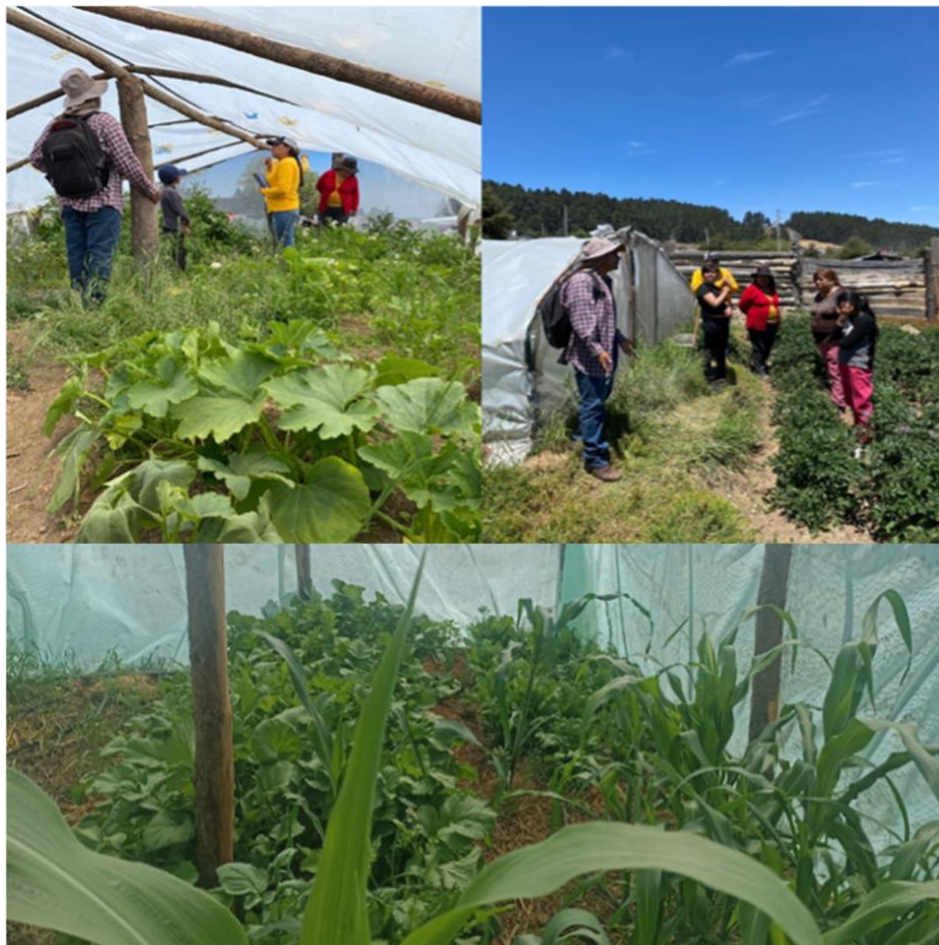
Figura 4. Diversidad de cultivos de hortalizas en el interior de los túneles manejados por mujeres en Los Pescados y El Conejo, Perote, Ver.

Una vez instalados los espacios de trabajo y elaboradas las enmiendas orgánicas a partir de materiales locales como restos de cosechas, desechos orgánicos de cocina y estiércoles, se prepararon las camas de cultivo que fueron dispuestas en la forma que las mujeres participantes consideraron más práctica para su manejo diario. Se trasplantaron las plántulas de diversas hortalizas, procediendo a regarlas para evitar la deshidratación en estas primeras etapas. Los túneles albergaron diversas hortalizas elegidas por su preferencia de consumo, además de plantas condimenticias como se aprecia en la Figura 4. El mantenimiento de los cultivos de hortalizas se realizó por parte de las responsables de cada túnel con apoyo de las infancias de sus familias, dedicando un tiempo de una a dos horas diarias en labores de riego, desmalezado, tutorado, aporcado y control de plagas mediante preparados naturales.