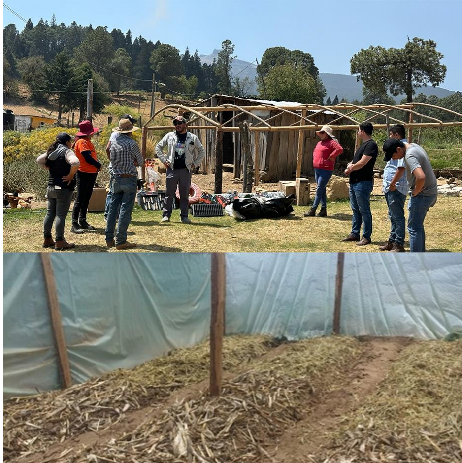
Figura 3. Instalación de túneles con materiales locales.