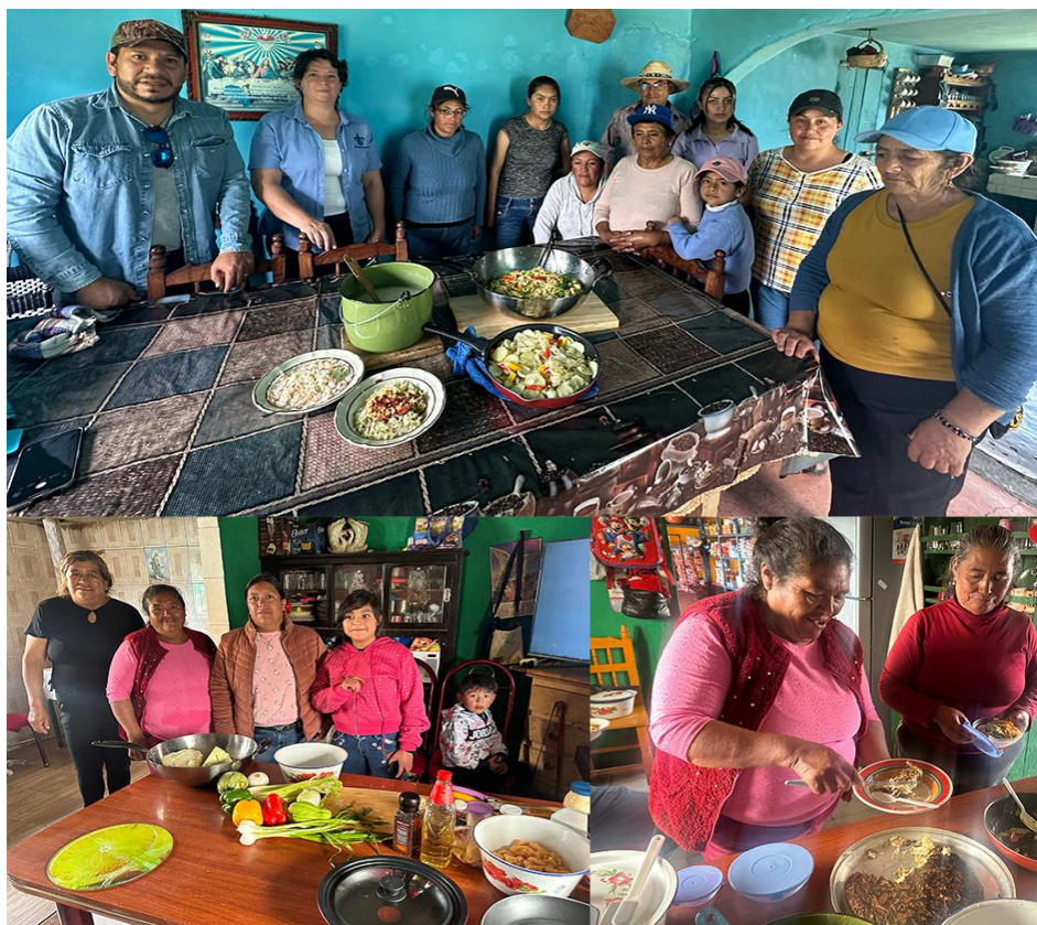
Figura 5. Talleres de cocina saludable del huerto.

Además, se les mostró como preparar pan al comal, mayonesa, pasta fresca y masa para empanadas de harina de trigo (Figura 5).