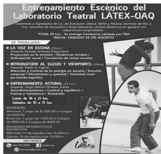
Figura 5. Cartel del entrenamiento escénico en el Laboratorio Teatral Látex-UAQ