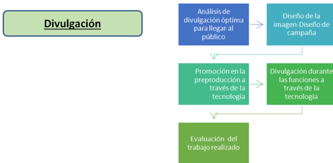
Figura 4. Etapas de la divulgación