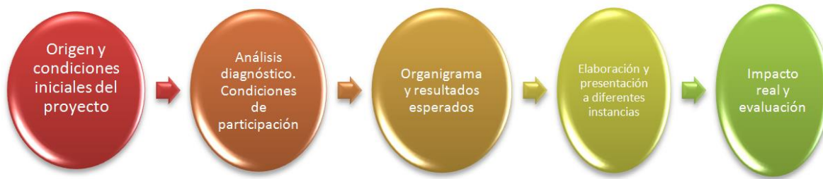
Figura 2. Preparación-presentación de proyectos (etapa de planeación)

Estudio, investigación y diagnóstico del proyecto y del contexto. Recursos disponibles. Contacto y relación con los involucrados. Detectar límites y posibilidades (De León, 2013, p. 27)