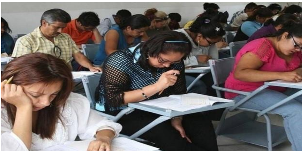
Figura 1. Docentes en el examen de conocimientos