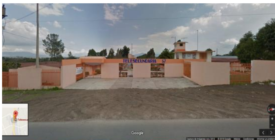
Figura 3. Escuela Telesecundaria 57, Almoloya Municipio de Acatlán, Hidalgo

realizan actividades mediante el Consejo de Participación Social; los padres de familia colaboran en el mantenimiento, económicamente, en actividades cívicas y socioculturales. Los alumnos se encuentran entre los 12 y 15 años de edad, algunos de ellos con problemas emocionales: cortarse o marcarse alguna parte de su cuerpo y desintegración familiar por motivo de la migración hacia los EE. UU., lo que refleja una transculturación en su comportamiento y la asunción de patrones de conducta externos (Alfaro, 1 de agosto de 2018, comunicación personal).