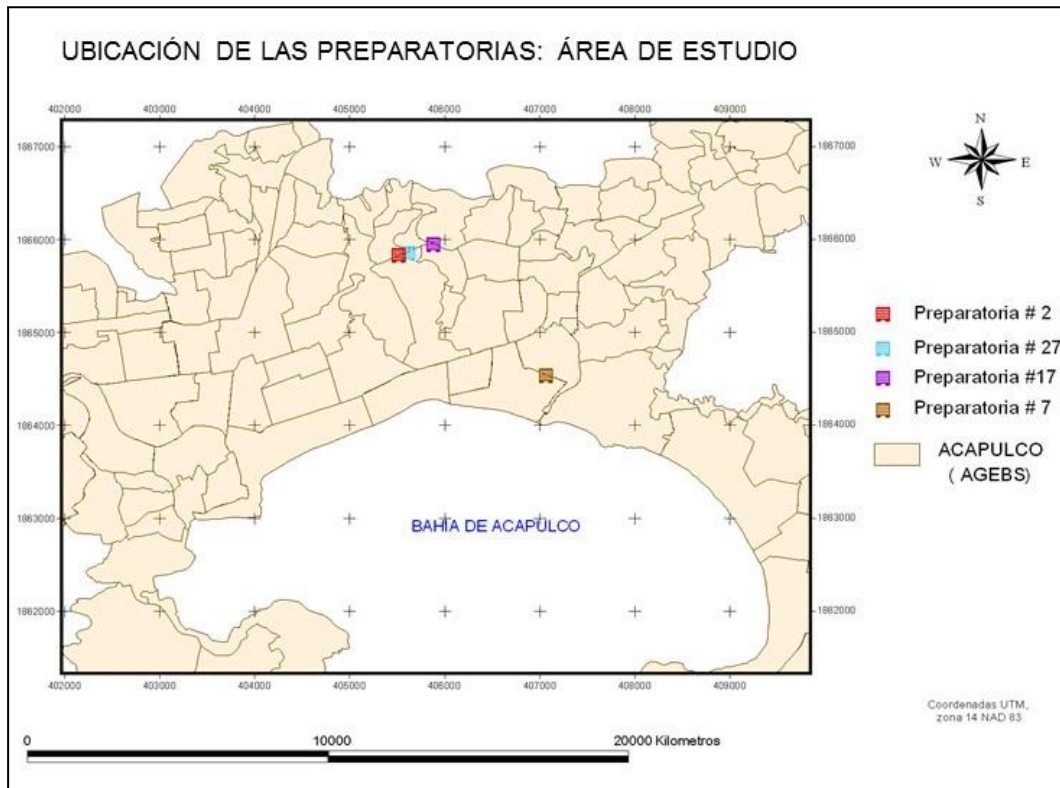
Figura 1. Mapa de ubicación de las preparatorias encuestadas de la UAGro